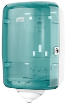
Tork Reflex M3 Dispenser Mini turchese 473167