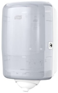
Tork Reflex M3 Dispenser Mini bianco 473177